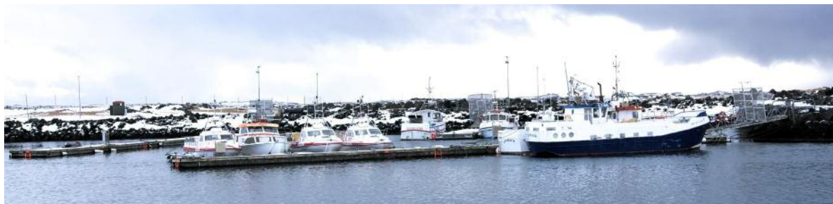
4.2 Afli íslenskra skipa botnfisktegundum innan lögsögu 2018/2019 og 2017/2018 (tonn upp úr sjó)

Upplýsingar um aflaverðmæti og ráðstöfun afla eru fengnar úr vigtar- og ráðstöfunarskýrslum sem kaupendur sjávarafla skila til Fiskistofu. Í þeim tilgangi hefur stofnunin tekið upp rafrænt kerfi þar sem skýrslum er skilað í gegnum vefviðmót. Það kerfi komst í fulla notkun á fyrsta ársfjórðungi 2018. Aflaverðmæti þorsks á síðasta fiskveiðiári nam tæplega 69 milljörðum króna en hefur hækkað jafnt og þétt eftir mikinn samdrátt árið 2016/17. Verðmæti ýsuaflans jókst einnig aftur um rúm-